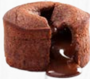
FONDANT CHOCOLAT GLACE VANILLE