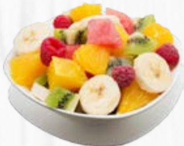
SALADE DE FRUITS