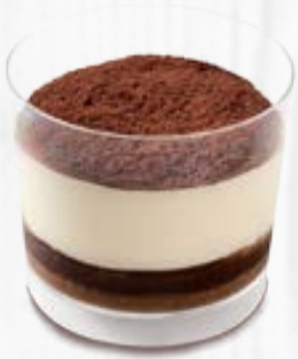
TIRAMISU NUTELLA / SPECULOS