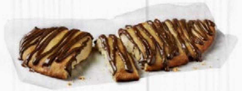
CHOCO PIZZ' NUTELLA